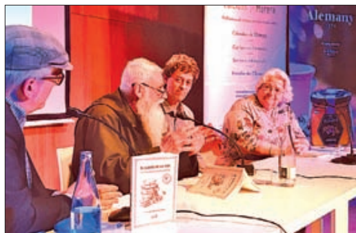
Moment de la presentació del llibre, a Barcelona

La novetat editorial forma part de les accions de la marca, dins del seu projecte ‘Univers Alemany. Art, Cultura i Humanitat , que vincula el vessant social de l’empresa a una tasca de pol·linització de l’opinió pública per engegar un debat sobre la convivència entre els humans i les abelles i la necessitat de supervivència d’aquests per garantir la vida al planeta. ‘El llibre de la mel’ és el setè títol de la Col·lecció l’Ermità i ens apropa el món de les abelles i la mel alhora que ens presenta algunes de les pràctiques apícoles més tradicionals de la Catalunya rural i conventual. A més, també ens parla de l’empremta cultural que l’apicultura ha deixat a la nostra societat a través de topò-